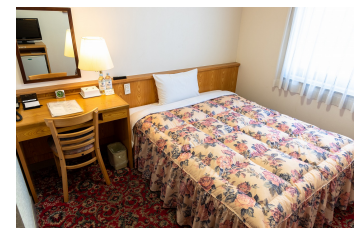
ゆったりシングルルーム1 DX Single Room 1