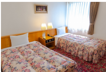
ツインルーム Twin Room