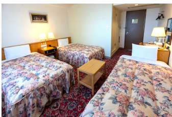
トリプルルーム Triple Room