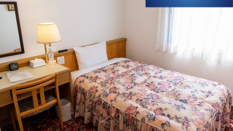
シングルルーム Single Room