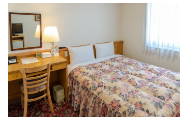
ダブルルーム Double Room