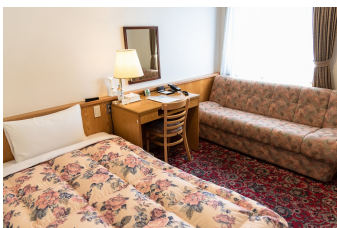
ゆったりシングルルーム2 DX Single Room 2