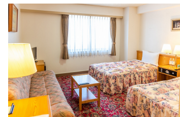
ゆったりツインルーム DX Twin Room