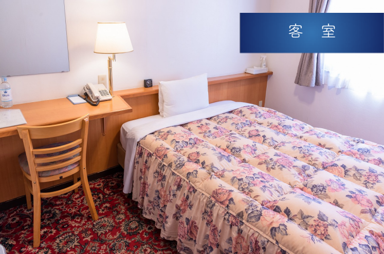
シングルルーム Single Room