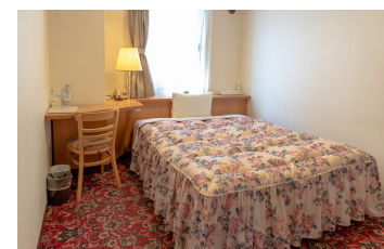
ゆったりシングルルーム1 DX Single Room 1