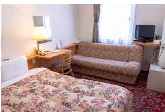
ゆったりシングルルーム2 DX Single Room 2