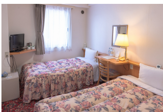
ツインルーム Twin Room