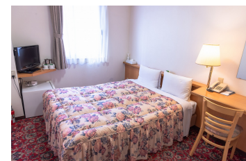
ダブルルーム Double Room