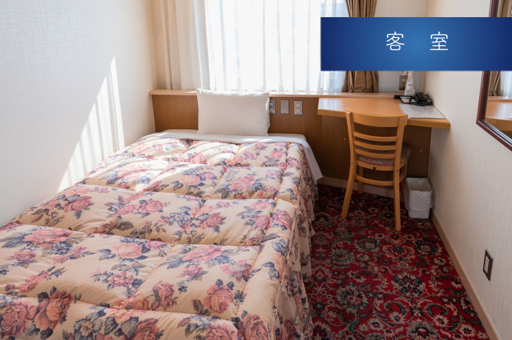
シングルルーム Single Room