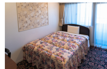
ゆったりシングルルーム(新館) DX Single Room