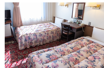
ツインルーム Twin Room