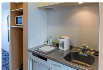
ミニキッチン(新館) Kitchen