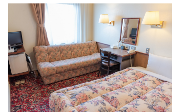
ゆったりシングルルーム DX Single Room