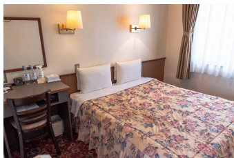
ダブルルーム Double Room