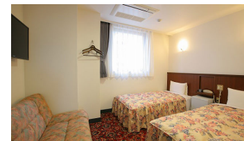
ゆったりツインルーム DX Twin Room