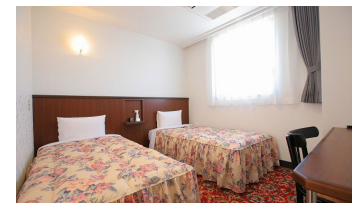
ツインルーム1 Twin Room 1