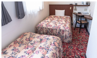
ツインルーム2 Twin Room 2