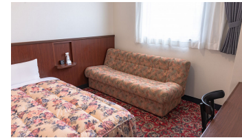
ゆったりシングルルーム3 DX Single Room 3