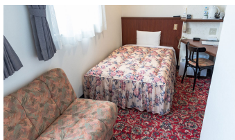
ゆったりシングルルーム2 DX Single Room 2