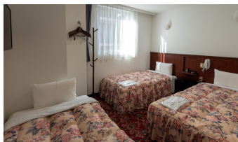
トリプルルーム Triple Room