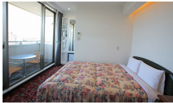
ダブルルーム Double Room