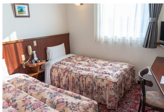
ツインルーム Twin Room