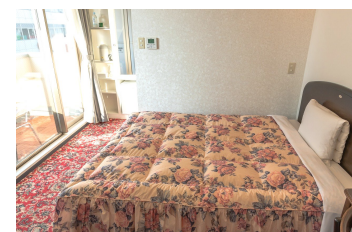
ゆったりシングルルーム1 DX Single Room 1