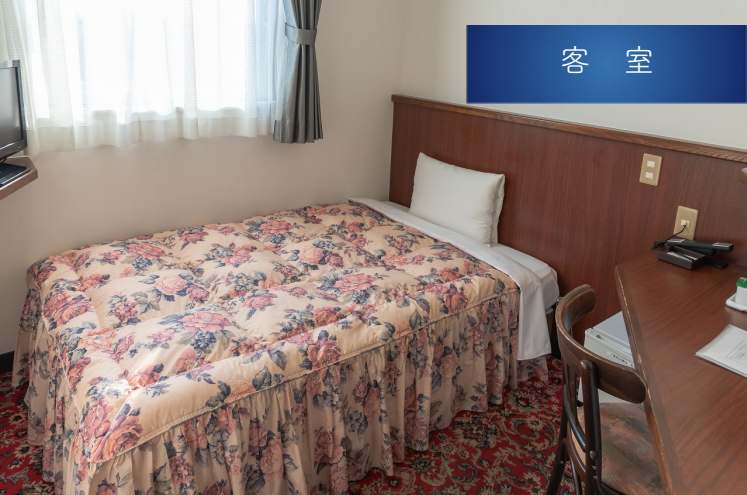
シングルルーム Single Room