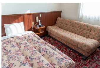
ゆったりシングルルーム2 DX Single Room 2