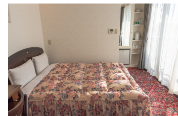
ダブルルーム Double Room