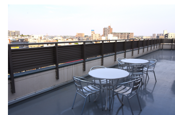
5F ルーフバルコニー Balcony