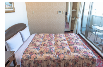
ダブルルーム Double Room