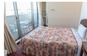
ゆったりシングルルーム1 DX Single Room 1