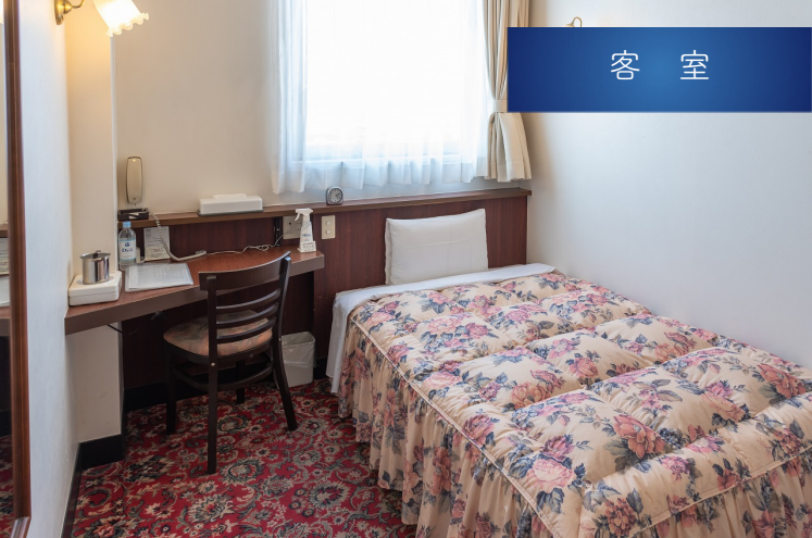
シングルルーム Single Room