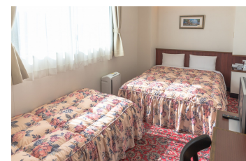
ファミリーダブル Family double