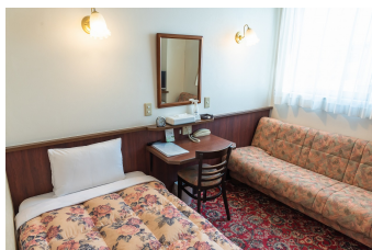
ゆったりシングルルーム2 DX Single Room 2