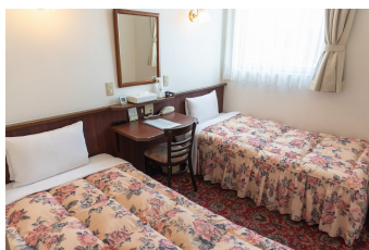
ツインルーム Twin Room