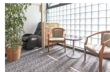
館内 Inside the facility