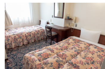
ツインルーム Twin Room