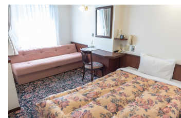
ゆったりシングルルーム DX Single Room