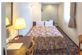
ダブルルーム Double Room