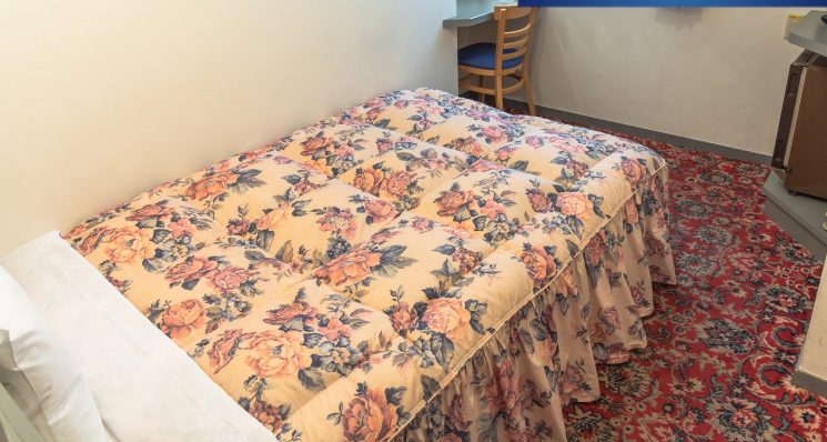
シングルルーム Single Room